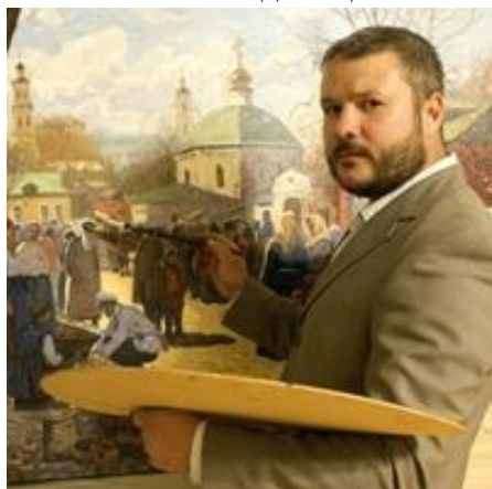
Фото выдающихся выпускников школы № 35 г. Пензы