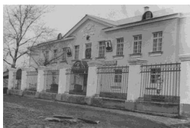
Здание средней школы №35 по улице Герцена, д.37 . Фото 1954 г.