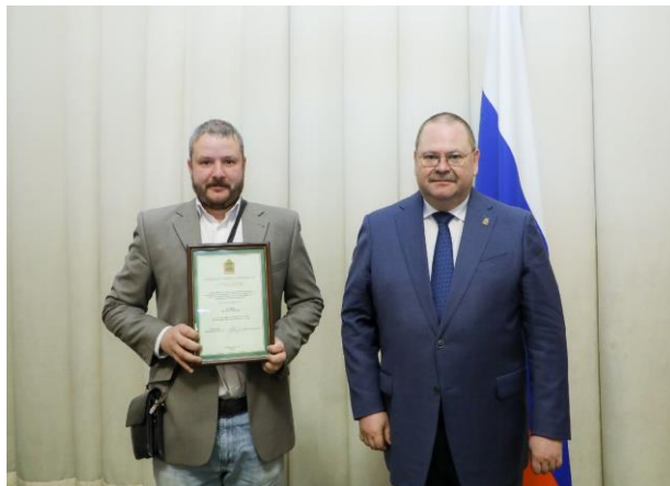
Валерий Андреевич Копняк - современный русский художник.