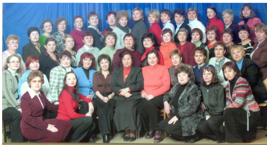
Педагогический коллектив МОУ СОШ №35 г.Пензы. Фото 2008 г