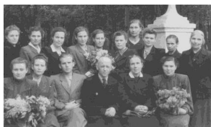
Первые учителя. Фото 1951 г